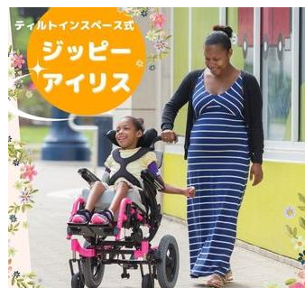
ジッピー アイリス