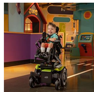
クイッキー Q300M mini キッズ