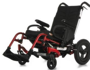
「クイッキー アクセス」