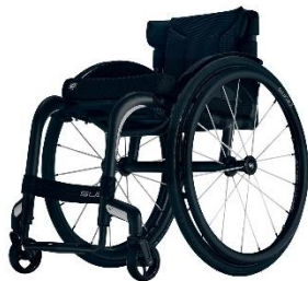
「RGK ハイプル サブ4」

H.C.R.2022の当社展示ブース内にて、RGK カーボンファイバー製車いす「ハイプル サブ4」、低床型ティルトクライニング車いす「クイッキー アクセス」、Q300Mminiシリーズのお子様対応サイズ電動車いす「クイッキー - Q300Mmini キッズ」等の新商品を展示いたします。是非この機会にご体験ください。