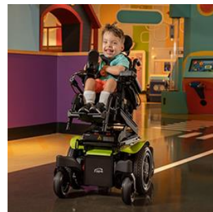
「クイッキー Q300Mmini キッズ」