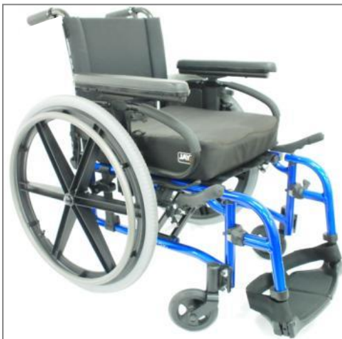
※クイッキーQXi 参考画像。JAYイオンクッションは別売りです。