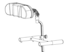
プッシュハンドル取付け型ヘッドレスト