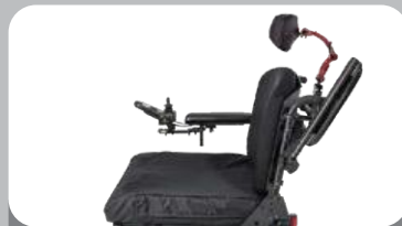
キャンティレバー アームレスト