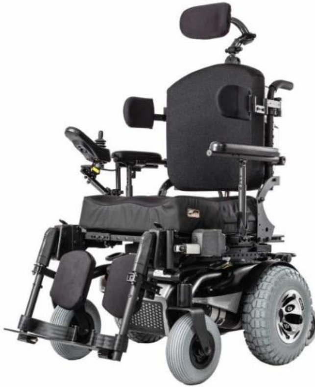
標準モデル 基本価格 840,000円