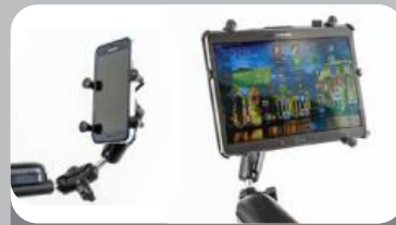
スマートフォンホルダー & タブレットホルダー