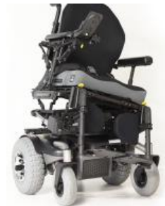
New ラテラルティルト

Quickie® Xplore 2™は後輪駆動の駆動力と中輪駆動の旋回性能、その両方を兼ね備えたハイブリッド型の電動車いす。Xplore 2™は、屋外で多くの時間を過ごすして遠くに行きたい人にとって理想的な車いすです。安全で快適な6輪独立サスペンションと車載固定金具は標準装備。シーティングオプションはティルト、手動&電動リクライニング、リフトが選択可能です。