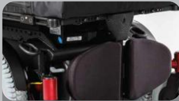
センターマウント