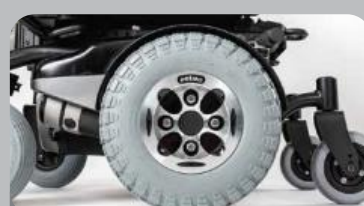
ドライブホイール