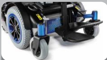
高さ調整式 フットプレート