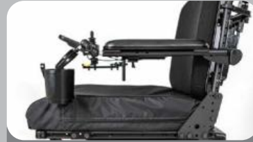
ドリンクホルダー