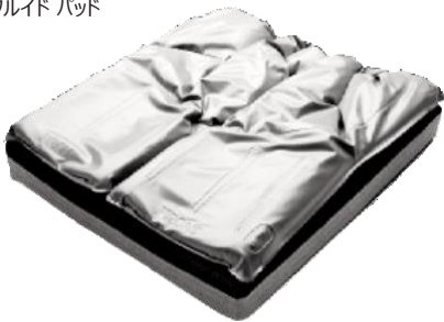
JAY フロー フルイド パッド