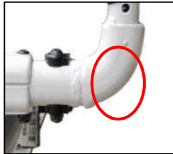
デスクサイドガード プレパレーションなし