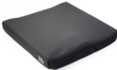
失禁対策用カバー